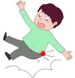
T é ngã