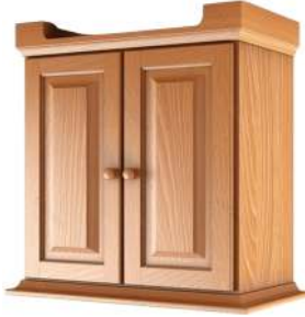
Cái t ủ