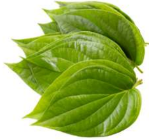
Má y m á y