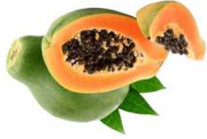
Trái đu đủ